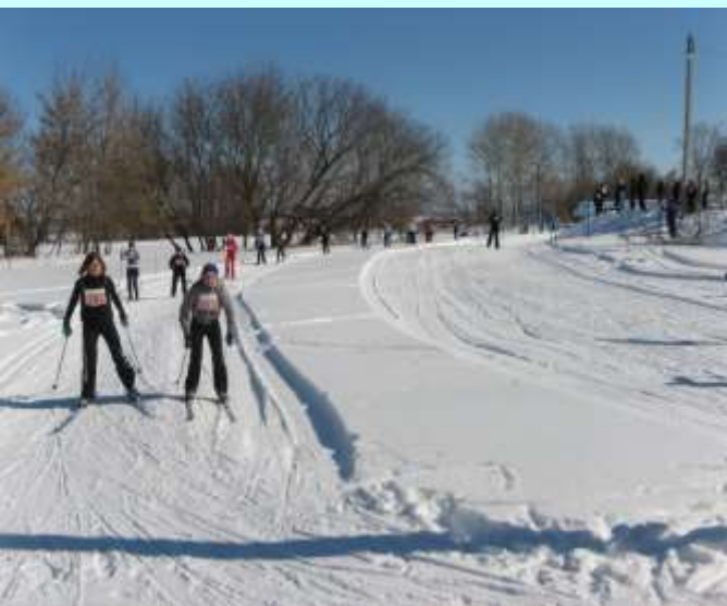
Лыжня России с.Алешино

футбольные поля, прокладываются лыжные трассы. Расширился круг соревнований, проводимых по месту жительства. Сельские жители имеют возможность посещать плавательный бассейн «Нептун» и новый, современный физкультурно-спортивном комплексе с ледовой ареной «Планета спорта».