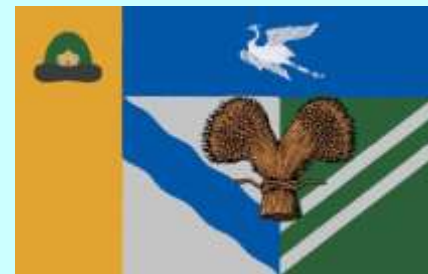
Флаг Сасовского муниципального района

Территория Сасовского района находится на юго-востоке Рязанской области. Общая площадь района составляет 181252,2 га.