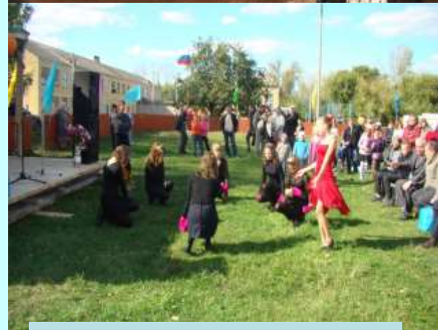
Сельский праздник в с.Берестянки