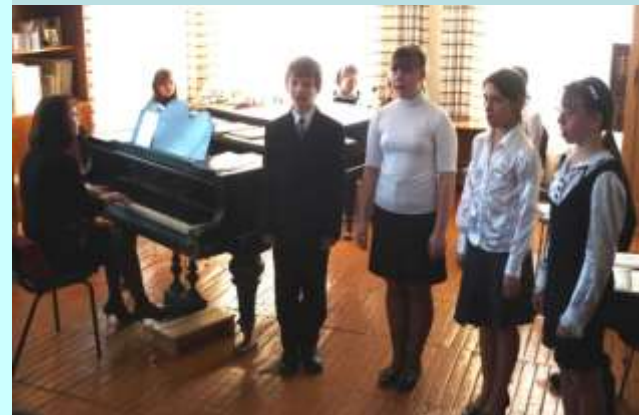
Детская музыкальная школа в с.Демушкино

гостей в д.Шафторка у дома-музея композитора. Большую социальную значимость приобретают крупные массовые праздники на селе – День поселка, села.