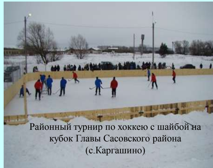
Районный турнир по хоккею с шайбой на кубок Главы Сасовского района (с.Каргашино)

Ежегодно растет удельный вес населения, систематически занимающегося физкультурой и спортом. Во всех зональных областных соревнованиях по видам спорта сборные команды Сасовского района занимали призовые места. В районе работает Детско-юношеская спортивная школа, где занимаются 490 человек по 7 видам спорта. Учебно-тренировочные занятия проводятся на спортивных базах общеобразовательных школ. В работе спортивных учреждений района акцент делается на массовое распространение спорта. В сельских поселениях активно строятся хоккейные коробки, обустраиваются