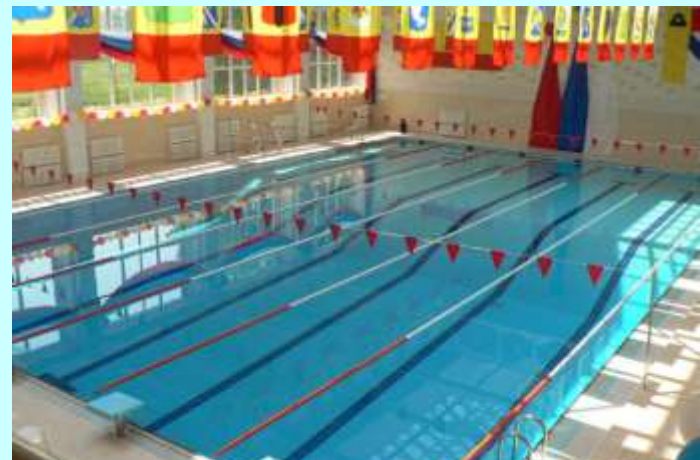
Плавательный бассейн «Нептун» в г.Сасово

футбольные поля, прокладываются лыжные трассы. Расширился круг соревнований, проводимых по месту жительства. Сельские жители имеют возможность посещать плавательный бассейн «Нептун» и новый, современный физкультурно-спортивном комплексе с ледовой ареной «Планета спорта».