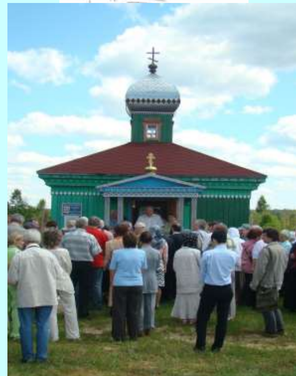
Памятные мероприятия на родине философа Н.Ф.Федорова в с.Ключи