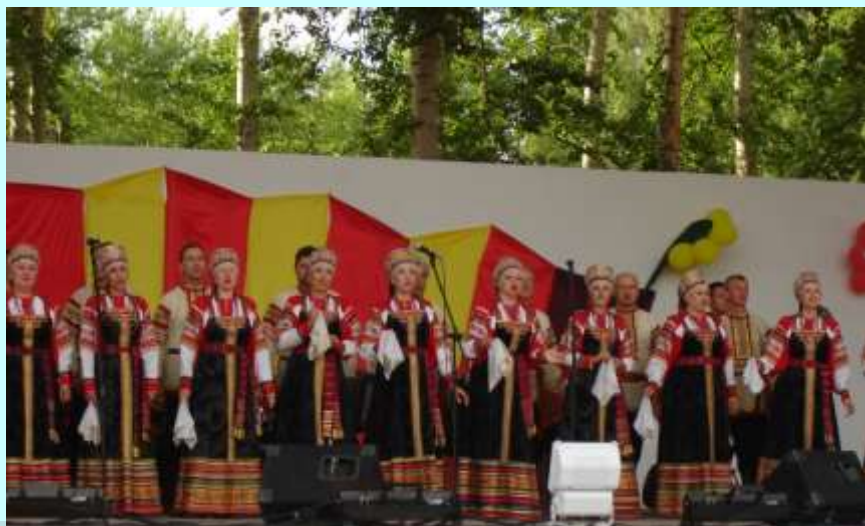
Выступление на фестивале Рязанского народного хора